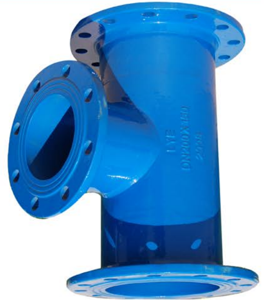
Medidas (mm) Bridas